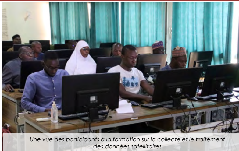
Une vue des participants à la formation sur la collecte et le traitement des données satellitaires

Afin d'améliorer la production, l'accès et l'utilisation de l'information issue des données satellitaires au Niger, deux stations de réception des données satellitaires installées en 2015 au Ministère de l'Agriculture et de l'Elevage ont été réhabilitées avec l'appui du Programme de résilience du système alimentaire en Afrique de l'Ouest... Lire plus