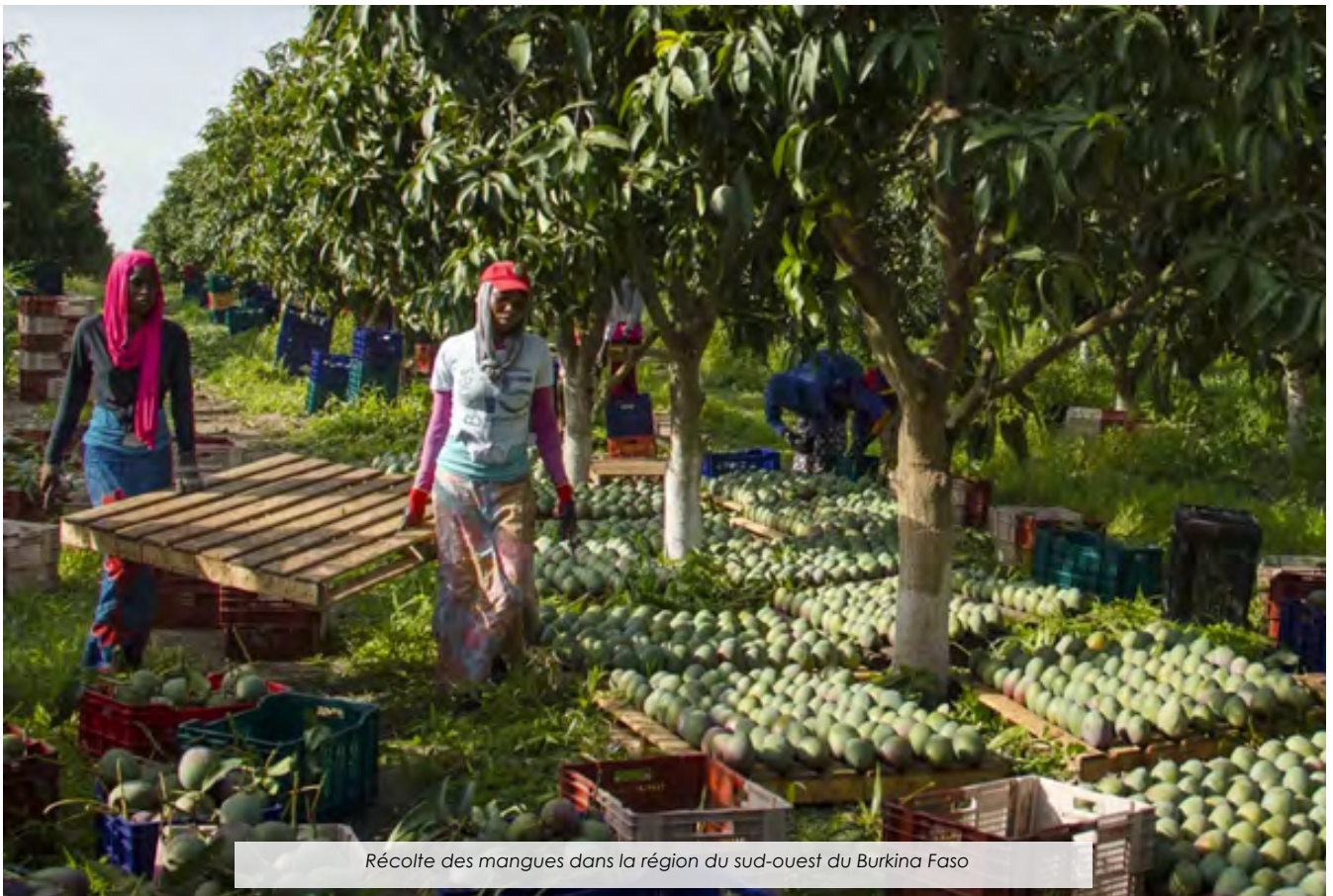
Récolte des mangues dans la région du sud-ouest du Burkina Faso

Bénéficiaires du programme de résilience du système alimentaire depuis 2022, le Burkina Faso et le Mali ont, à leur actif, de nombreuses réalisations en vue de contribuer à renforcer la résilience de plusieurs populations vulnérables. Voici quelques principales réalisations au terme de l'année 2023... Lire plus