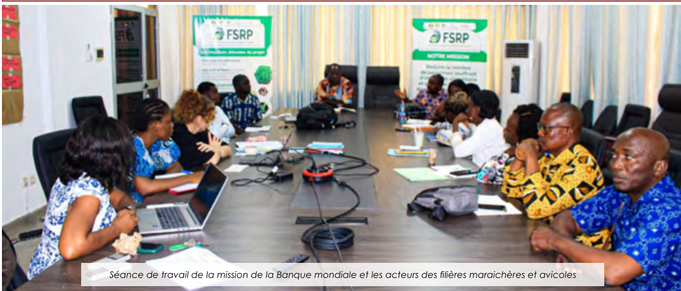
Séance de travail de la mission de la Banque mondiale et les acteurs des filières maraichères et avicoles

Dans le cadre de la mise en œuvre du FSRP, le Togo bénéficie de l'appui de la Banque mondiale pour évaluer l'infrastructure de la chaîne de froid dans les filières maraichères et avicoles. A cet effet, il a été organisé du 14 au 22 mars 2024 des rencontres d'échange avec les acteurs des deux filières sélectionnées pour évaluer l'infrastructure de la chaîne de froid et identifier les cas commerciaux potentiels pour les chambres froides au Togo... Lire plus