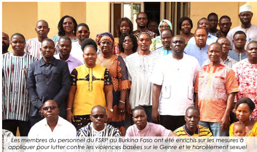
Les membres du personnel du FSRP au Burkina Faso ont été enrichis sur les mesures à appliquer pour lutter contre les violences basées sur le Genre et le harcèlement sexuel