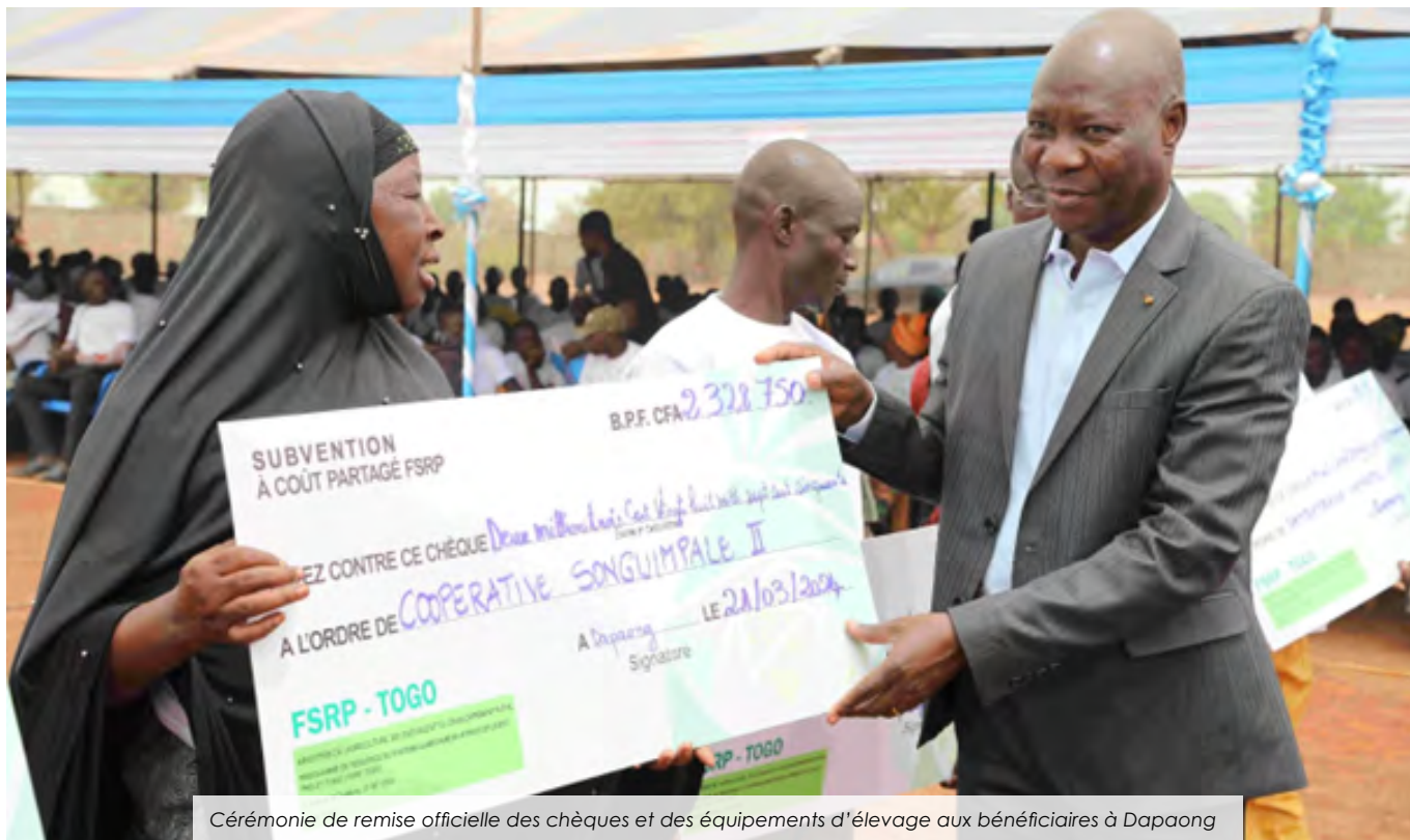
Cérémonie de remise officielle des chèques et des équipements d'élevage aux bénéficiaires à Dapaong

Le 21 mars 2024, à Dapaong, les acteurs et partenaires du développement agricole ont assisté à la remise officielle des matériaux de construction, des équipements d'élevage et des chèques au profit des éleveurs et bénéficiaires du Programme de Résilience du Système Alimentaire en Afrique de l'Ouest... Lire plus