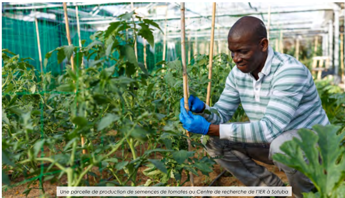
Une parcelle de production de semences de tomates au Centre de recherche de l'IER à Sotuba