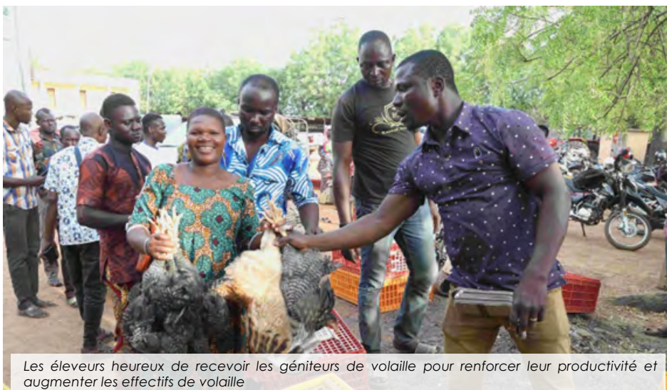
Les éleveurs heureux de recevoir les géniteurs de volaille pour renforcer leur productivité et augmenter les effectifs de volaille

L'élevage des volailles (poules et pintades) est une pratique courante dans la région des savanes autrefois appelée la région de l'or gris. C'est aussi le domaine par excellence du rônier et de la culture attelée où les communautés vivent en partie de la production et de la commercialisation des volailles ... Lire plus