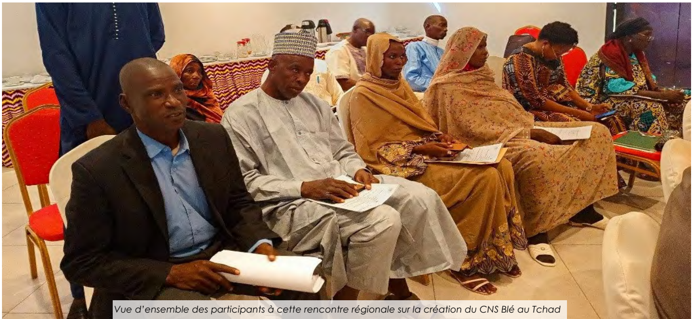
Vue d'ensemble des participants à cette rencontre régionale sur la création du CNS Blé au Tchad