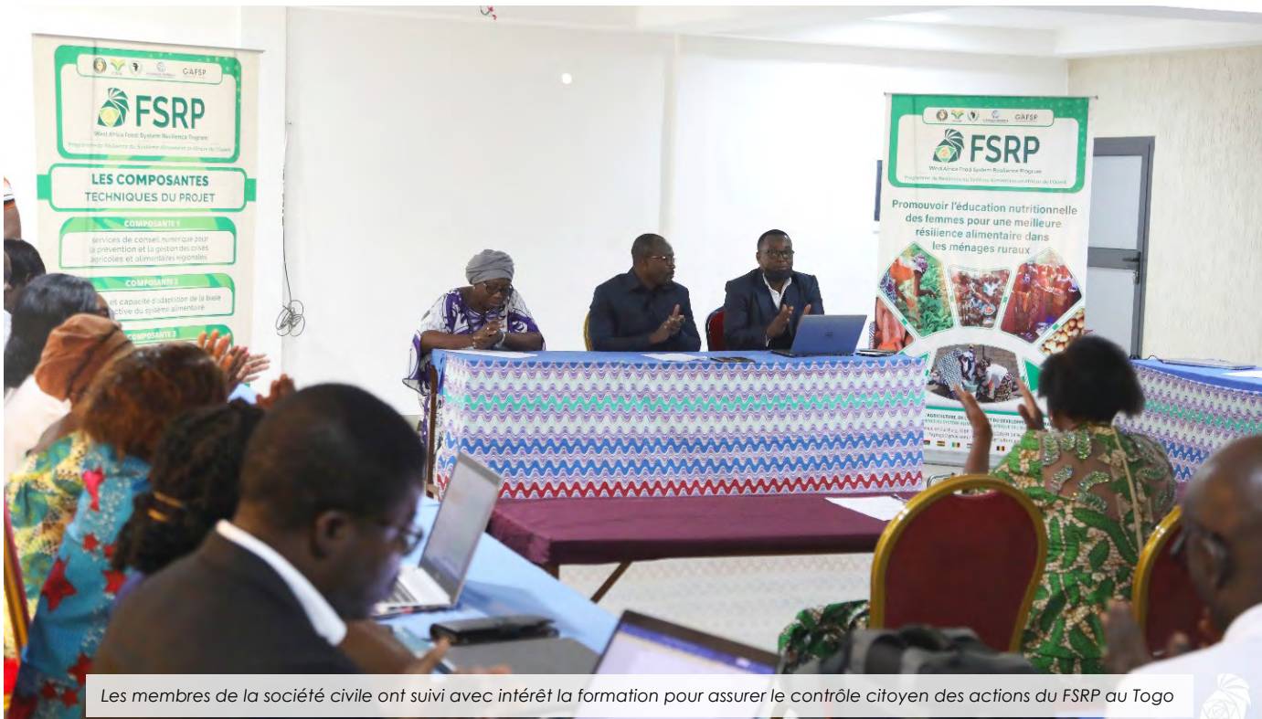
Les membres de la société civile ont suivi avec intérêt la formation pour assurer le contrôle citoyen des actions du FSRP au Togo

Pour renforcer la nécessité de redevabilité dans la mise en œuvre de ses financements, le contrôle citoyen des activités par la société civile a été intégré au dispositif de suivi évaluation du Programme de Résilience du Système Alimentaire en Afrique de l'Ouest, (FSRP-Togo). A cet effet, il a été organisé du 18 au 19 Janvier 2024 à Kpalimé (région des plateaux Ouest) une formation des membres des organisations... Lire plus