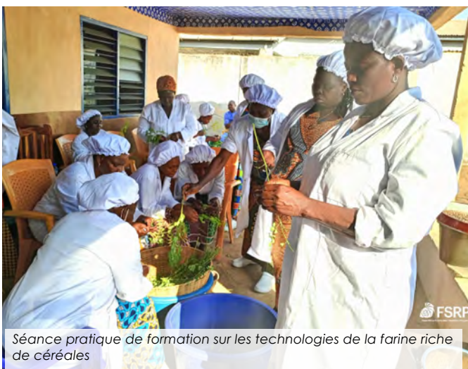
Séance pratique de formation sur les technologies de la farine riche de céréales