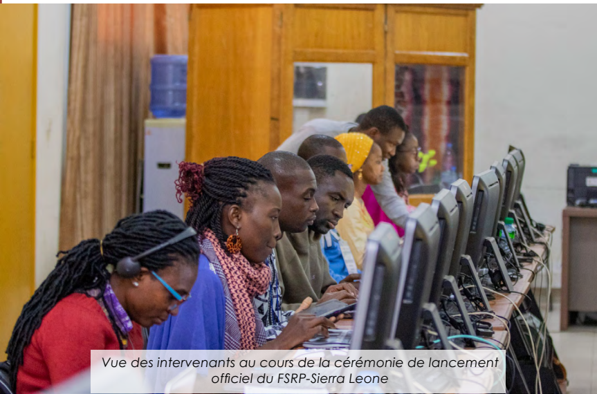
Vue des intervenants au cours de la cérémonie de lancement officiel du FSRP-Sierra Leone