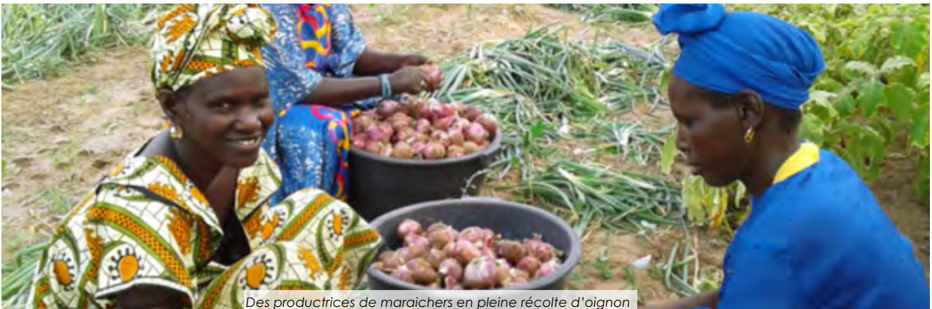
Des productrices de maraichers en pleine récolte d'oignon